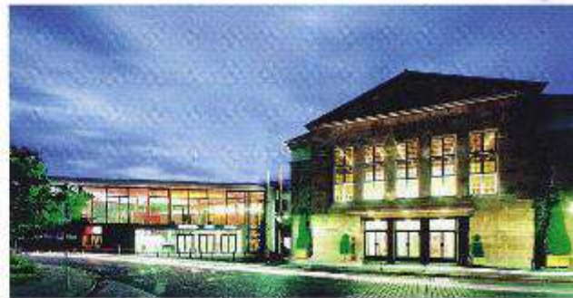
Zentral am Rande der Altstadt gelegen: das multifunktionale Veranstaltungszentrum „Congress Park Hanau“.

Schwerpunktmäßig kommen alle Aussteller wie in den letzten fünf Jahren aus der jeweiligen Region, in der die „LOCATIONS“ stattfinden und – sie bieten Außergewöhnliches: eine besondere Geschichte, eine exponierte Lage oder überraschende, mul-