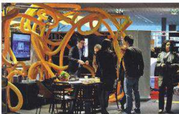
Die dritte im Bunde: Gut besucht und überraschend anders – die „LOCATIONS Rhein-Neckar 2012“.

Zwei der vier diesjährigen LOCATIONS-Messen haben bereits stattgefunden und konnten sowohl bei Aussteller- als auch Besucherzahlen ein gutes Wachstum verbuchen. Auch für die anstehenden „LOCATIONS Rhein-Ruhr“ am 20. September 2012 im Congress Center West der Messe Essen sowie der „LOCATIONS Rhein-Main“