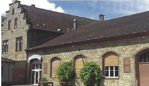
Der Winzerkeller der Rotweinstadt Ingelheim

Weinstitutes und als Unternehmen des Jahres im Landkreis Mainz-Bingen betitelt. Alte und neue Architektur wurden perfekt vermählt in dem inspirierenden Haus mit leider nur 19, aber ausgesprochen schönen Zimmern, die es zudem zu unerwartet günstigen Konditionen gibt. Die gute Nachricht: Ab 2017 sollen weitere Zimmer hinzukommen. Kloostergastronomie, wunderschöne Tagungsräume bis 80 Personen, gute Küche – was für ein Ort der heiteren Kontemplation in einer stillen Randlage zum Stadtzentrum – Prädikat: Sehr empfehlenswert! www.wasem.de