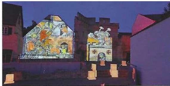
Oben: Alte Markthalle, oben rechts: Die Nacht der Kunst, rechts: die Hafenmole von Ingelheim