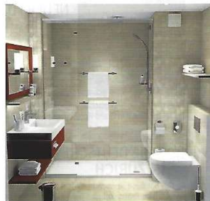
Links: moderner Auftritt im Zentrum Ingelheims: die Fassade des IBB Hotel Saalwächter Oben: Die Zimmer punkten mit bequemen Betten und geräumigen Bädern.

Das IBB Hotel Ingelheim mit 103 Zimmern und sechs Studios präsentiert sich lässig-elegant mit natürlichen Materialien und stylischen Möbeln, kombiniert mit trendigen Farben wie warmen Rot- und Erdtönen und frischem Grün. In den rund 20 qm großen Zimmern liegt das besondere Augenmerk auf geräumigen und geschmackvoll eingerichteten Bädern sowie bequemen Betten. Ein Besprechungsraum für 12 Personen mit fest installierter Boardroom-Technik sowie ein Fitnessraum für die Hotelgäste runden das Angebot ab. Geräumige Tagungskapazitäten bieten in direkter Nachbarschaft die neue KING Kultur- und Veranstaltungshalle und das ICC Media Konferenzzentrum. www.ibbhoteles.com